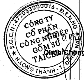
Châu Thành Jen